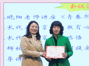
▶ 聘请家庭教育专家