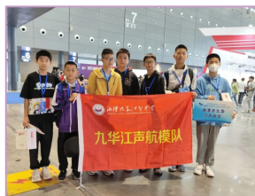
▶ 全国青少年航海模型锦标赛一等奖获得者