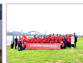
▶ 学雷锋志愿者活动