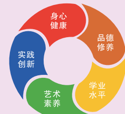
五好学生综合评价

改进结果评价，强化过程评价，探索增值评价，健全综合评价，以科学评价激发师生潜能、激活发展动力。