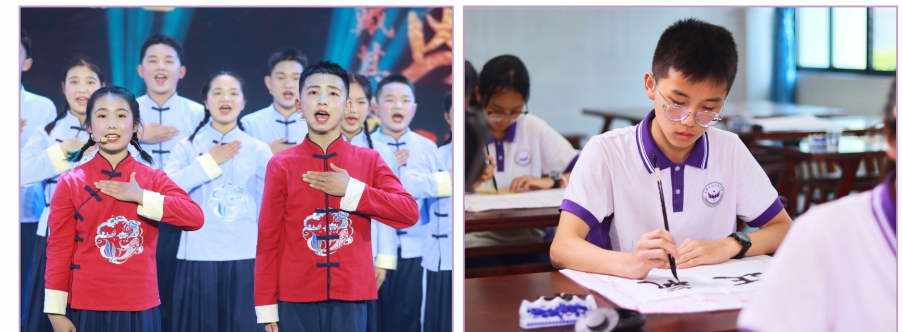
经典诵读荣获湖南省特等奖